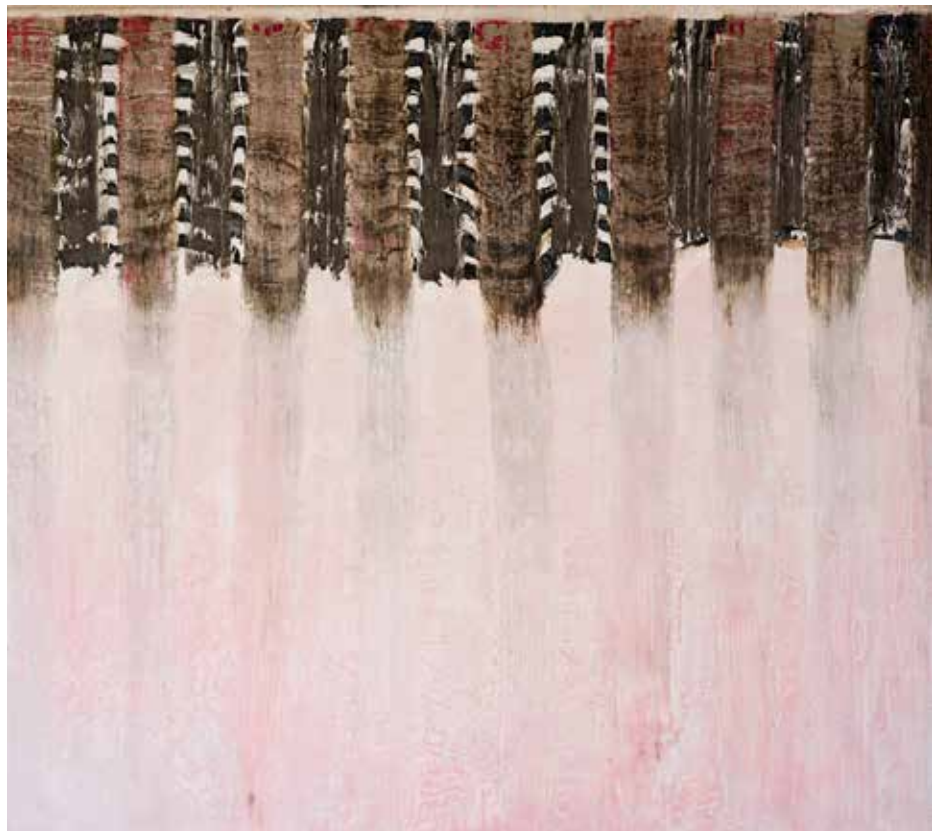
The fence fades at early dawn