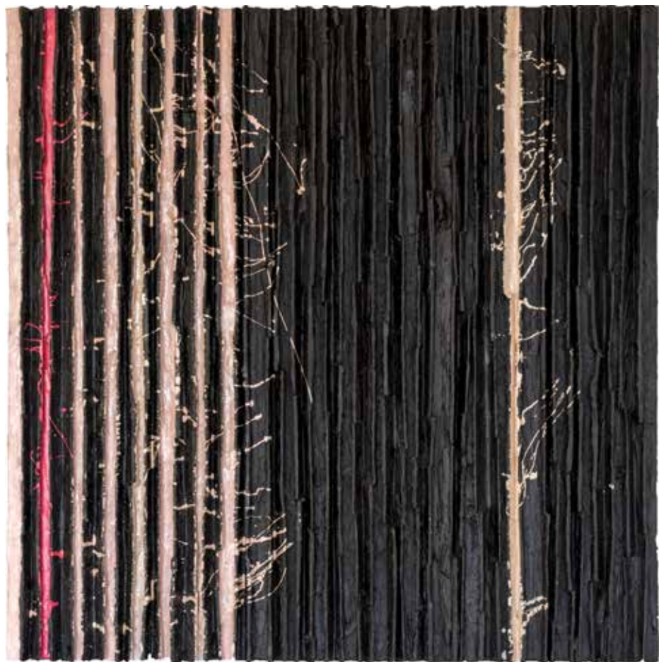
Mystic van Eijck breekt door