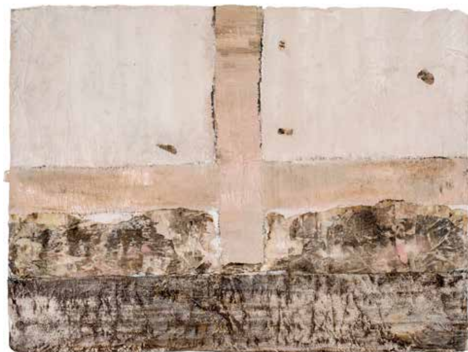
Kwetsbaar, een nieuwe vlag boven pas veroverd gebied