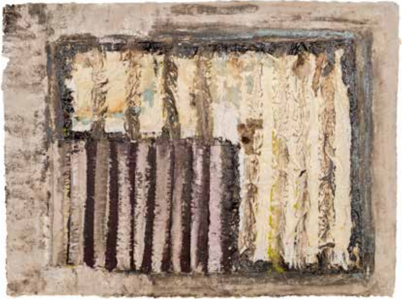
Backyard view from its own personal wasteland