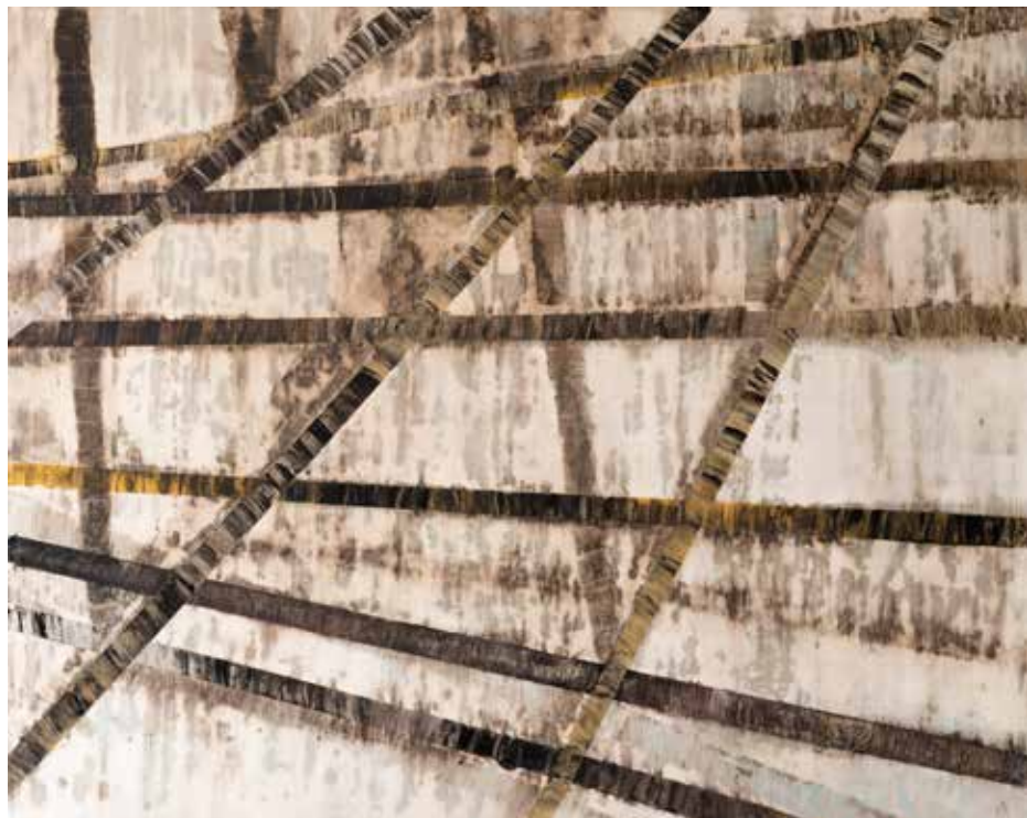
Grid with a lost purpose