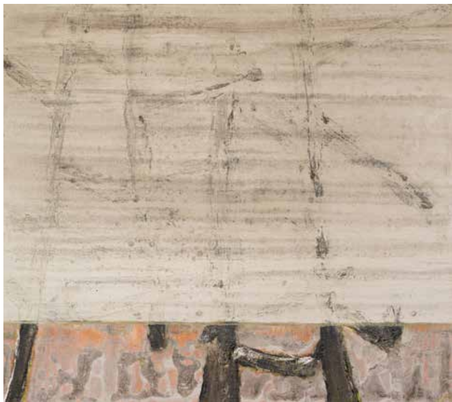
Moments to go